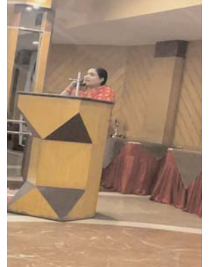
आवश्यकता है। महिला अधिवक्ताओं

कार्यक्रम के दौरान वक्ताओं ने कहा कि अधिवक्ताओं की समस्याओं के समाधान और उनके अधिकारों की मजबूती के लिए मजबूत नेतृत्व की