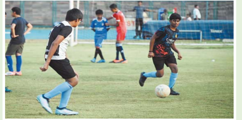
भोपाल। शहर के टीटी नगर स्टेडियम आयोजित समर कैप में बच्चे ले रहे हैं हिस्सा।