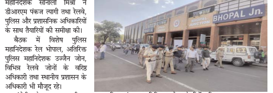
सुब्यवस्थित संचालन सुनिश्चित करने के निर्देश दिए। उन्होंने बल सदस्यों की समस्याएं भी सुनीं और कार्यप्रणाली को और अधिक प्रभावी बनाने के लिए सुझाव लिए। कार्यक्रम में सिंहस्थ मेला 2028 के दौरान रेलवे और प्रशासनिक विभागों के बीच बेहतर समन्वय और संयुक्त कार्ययोजना पर विशेष जोर दिया गया।